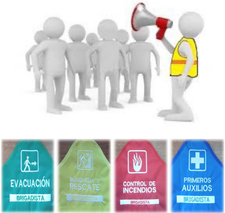
Figura 3. Brazaletes de identificación de las brigadas de la Unidad Interna de Protección Civil

posible, lamentablemente en ocasiones se dejan de lado las medidas de precaución y prevención, lo cual genera en algunos casos momentos desagradables y se presentan incidentes que pueden ocasionar lesiones o la muerte.