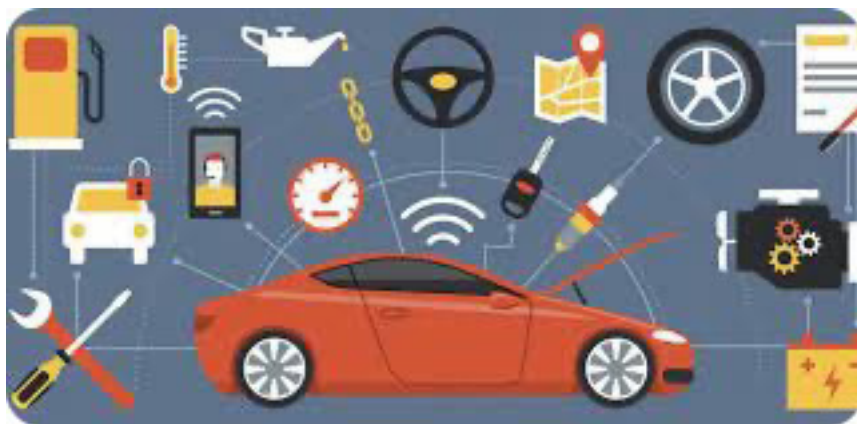
Figura 5. Elementos de revisión preventiva en vehículos

a los menores es una tarea que se debe llevar a cabo todos los días, y de manera conjunta entre las autoridades de diferentes niveles de gobierno, empresarios del sector privado, prestadores de servicio, padres y madres de familia y sociedad en general.