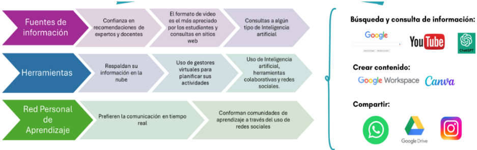
Figura 1. Resultados generales de la configuración del PLE de los estudiantes de bachillerato