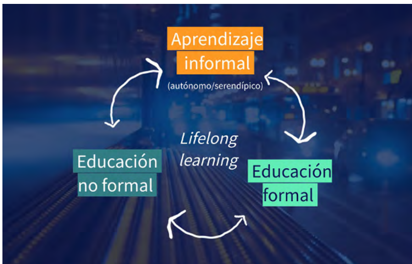
Figura 2. Ciclo dinámico del aprendizaje a lo largo de la vida

En su informe Faure et al. (1972) integran los diversos modos de aprendizaje bajo el concepto de educación permanente. Posteriormente, Delors et al. (1996) proponen cuatro pilares del aprendizaje —aprender a ser, conocer, hacer y convivir— que atraviesan entornos formales, no formales e informales. La visión metaformativa de la investigación se sitúa en esta tradición educativa: propone una articulación deliberada de la educación formal, no formal e informal en un modelo conceptual que refleje cómo las personas realmente aprenden a lo largo de sus vidas (véase la figura 2).