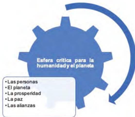
Figura 1. Esferas de importancia crítica para la humanidad y el planeta