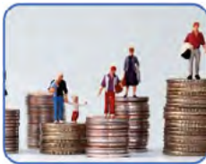
Figura 3. Formas de desigualdades recurrentes en la población mundial basados en los indicadores reiterativos presentes en los nueve Informes Anuales de los ODS analizados

11 El coeficiente de Gini mide la desigualdad de ingresos y oscila entre 0 y 100, donde 0 indica que los ingresos están distribuidos de manera equitativa entre todas las personas y 100 indica que una persona representa todos los ingresos.