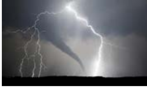
Figura 1.3. Ejemplo de condiciones climáticas

Fuente: Canvus.ai (2025). Representación de las condiciones climáticas.