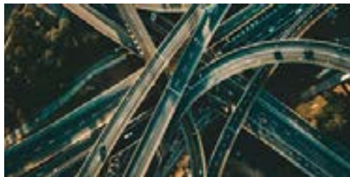
Figura1.2. Ejemplo de tráfico vehicular