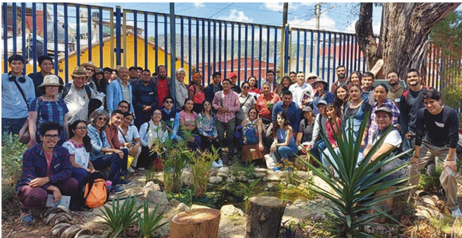
Figura 5. Presentación del libro Huertos en instituciones de educación superior: Relatos y experiencias desde México (abril de 2024)

Finalmente, el tiempo de vida del Huerto Universitario muestra que este proyecto no surgió en respuesta a objetivos institucionales, sino a contextos específicos y que el propio proyecto se reinventa, orientándose sobre todo a las ideas colectivas que se traducen en sueños y esperanzas colectivas, que ciertamente transforman el entorno, y lo llegan a convertir en una “isla de vida”, que también transforma a los seres humanos que trabajan en ella.