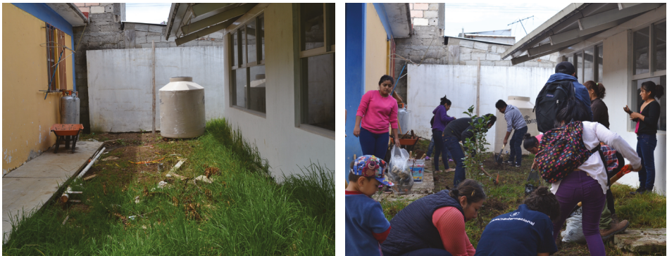
Figuras 1 y 2. El Huerto Universitario entre las dos cafeterías de la Facultad de Ciencias Sociales UNACH (2017).

Posteriormente, en el 2017 el Huerto Universitario ocupó un nuevo espacio, al fondo de la institución —entre las dos cafeterías—. Técnicamente era un espacio poco apropiado porque había pasto, escombros y exceso de sombra; sin embargo, contaba al menos con la certeza de tener un documento que respaldaba el préstamo y la autorización por parte del director de la Facultad. Las prácticas transformaron el lugar de forma lenta; no había herramientas y las pocas que había eran prestadas. Por otro lado, se donaban semillas, plantas, así como trabajo de estudiantes y profesores. Ese mismo año llegó un financiamiento de parte de Fondos de Ayuda Solidaria (FASOL), recurso que impulsó las actividades del huerto: se construyó la infraestructura para el captador de agua de lluvia; se compraron materiales, herramientas agrícolas y tablas de madera para la elaboración de camas y de la composta. Con lo material resuelto, decidimos hacer trabajo colectivo, transformando un espacio abandonado en un lugar fértil y con plantas (figuras 1 y 2).