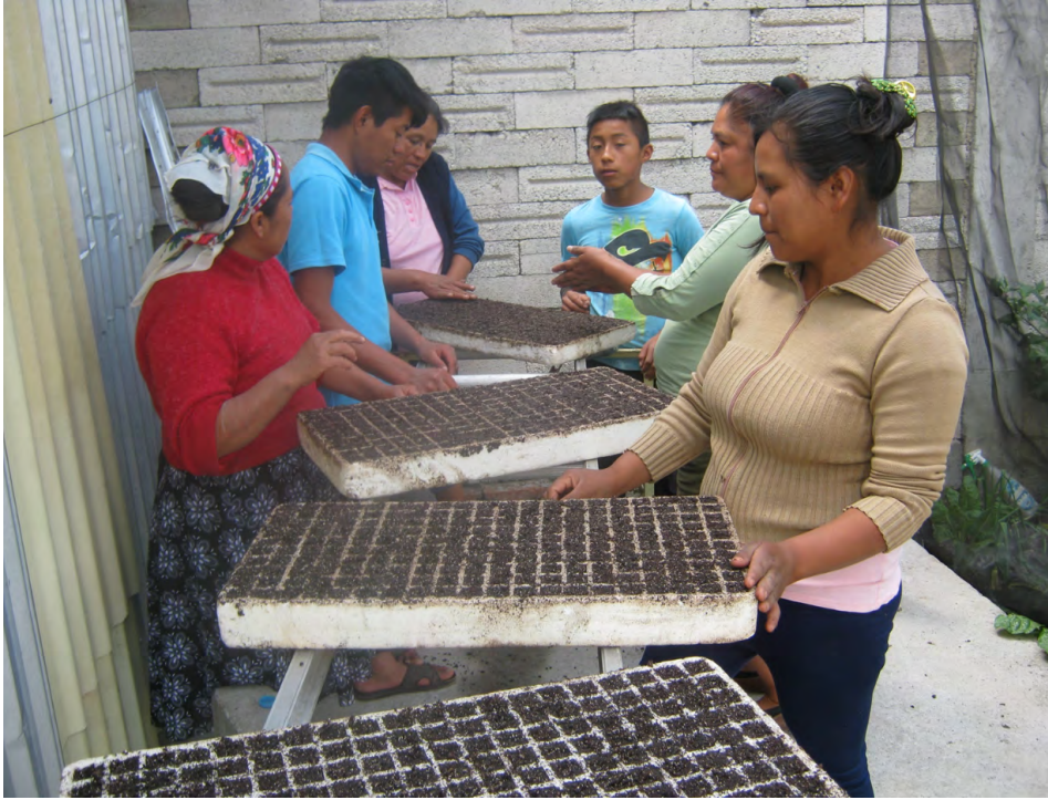
Figura 2.1 Proceso de capacitación para la producción de plántula de hortalizas.