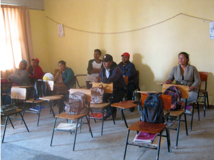
Figura 3.1. Inclusión de adultos en la capacitación

la importancia de proyectos de internet comunitario. Es necesario un programa de capacitación que prevea el asesoramiento psicopedagógico personalizado para la atención a la diversidad, ver los espacios escolares como lugares de creación, imaginación y aprendizaje y escenario de resistencia, libertad y reflexión. Se plantea la formación de semilleros, con base en la experiencia colombiana, para fomentar la investigación a partir de la transversalidad curricular, el clima y violencia escolar pueden relacionarse con las percepciones de esfuerzo y tolerancia a la frustración, incidir en la construcción de futuros y presentes ciudadanos que establezcan de forma natural las relaciones basadas en la igualdad, equidad e inclusión y privilegien las relaciones comunitarias, fomentando hábitos a favor del cuidado de sí y de otros. Se plantea la creación de un curso MOOC con el fin de ayudar a aquellos interesados que quieran crear sus propios cursos de este tipo y se recomienda a las instituciones que diseñan y administran exámenes en formato de opción múltiple que realicen análisis de ítem con la finalidad de incrementar la calidad de los mismos y la fidelidad del examen y sus resultados.