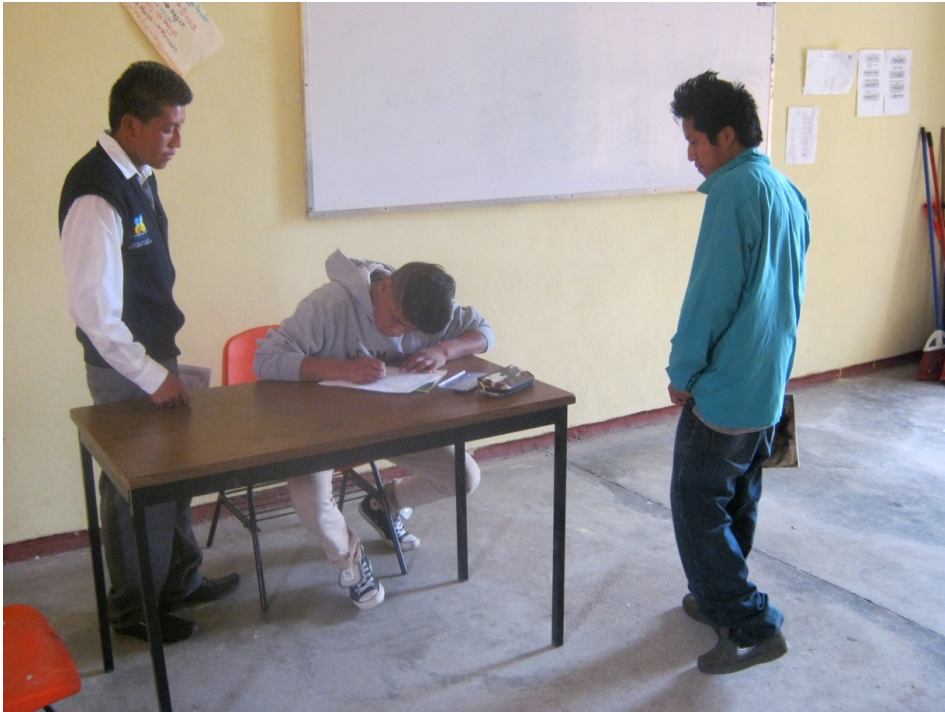
Figura 4.1. Registro para vacunación primera etapa COVID-19

Palabras clave: capacidad de trabajo, educación, estrés, salud.