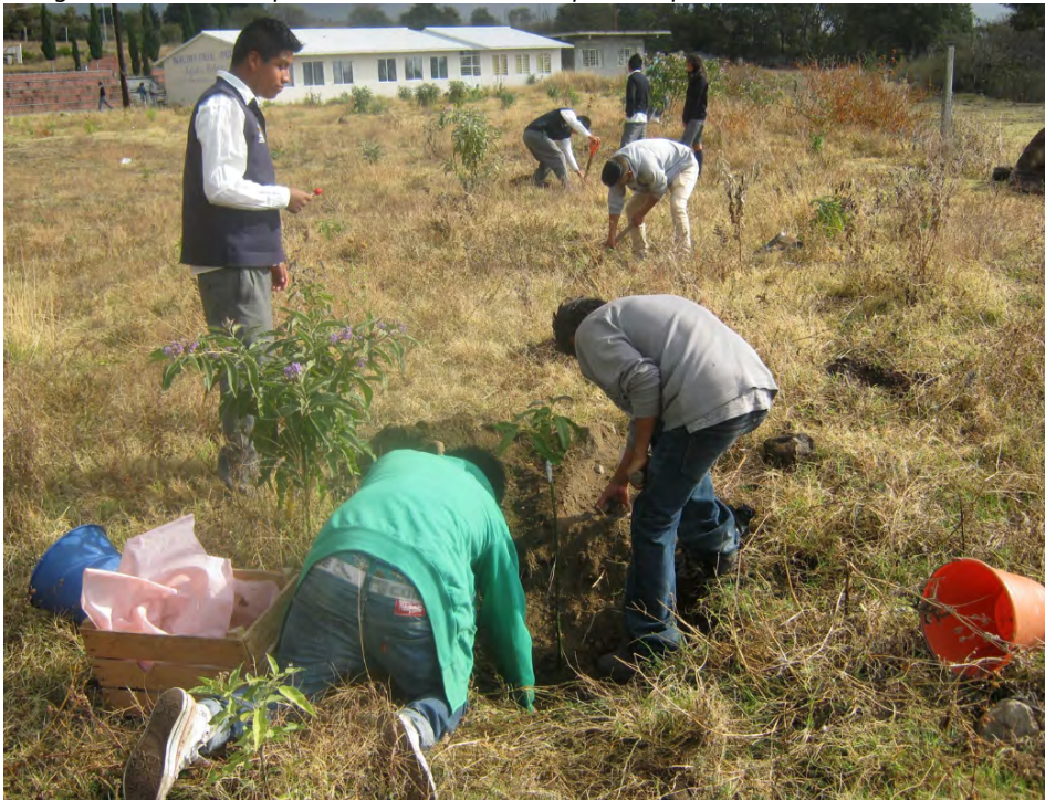
Figura 5.1. Práctica de plantación de árboles como parte del proceso de educación ambiental

Palabras clave: educación ambiental, sostenibilidad, pedagogía del lugar.