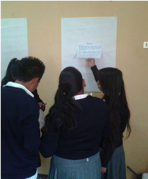
Figura 6.1. Conclusiones sobre el árbol de problemas sobre el agua

En tres instituciones educativas públicas de la localidad de Suba en Bogotá, Colombia se concluyó que en el saber pedagógico en contextos educativos de carencia y pobreza es necesario reconocer la importancia del conocimiento del contexto educativo y sus incidencias en el proceso, como base para proponer estrategias para transformarlo. Visibilizar procesos de empoderamiento de los actores educativos acordes con la propia realidad social y educativa, las cuales permiten el desarrollo de prácticas que potencien su autonomía, pensamiento crítico y autogestión.