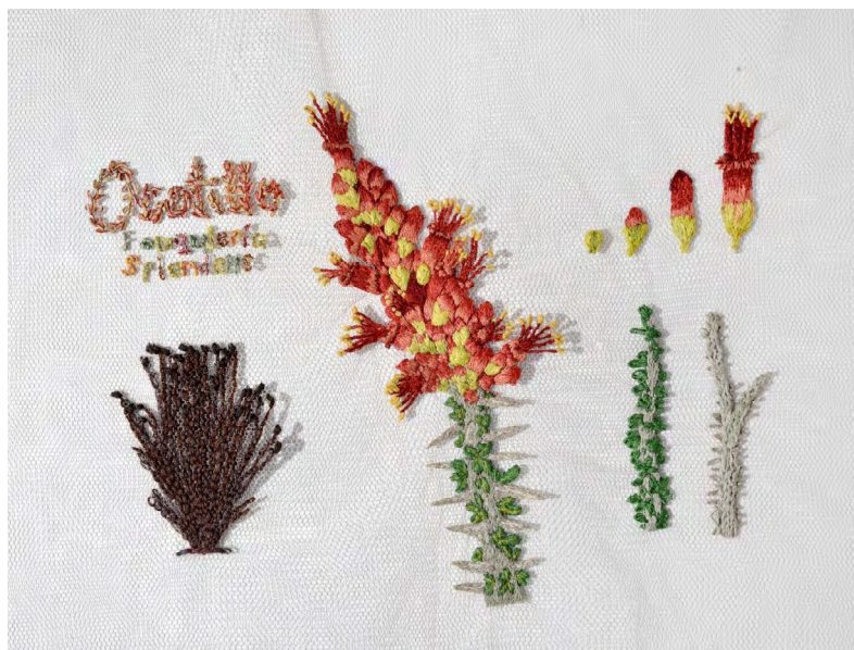
Figura 2. Resiliencia , 2023 (Ocotillo [ Fouquieria splendens ])

Durante mi proceso creativo, reflexioné sobre lo que significa la vida en el desierto y las características de cada planta; dedicaba tiempo a imaginar cómo darle valor a todo lo que representan y me permitía escuchar lo que cada una me susurraba en secreto.