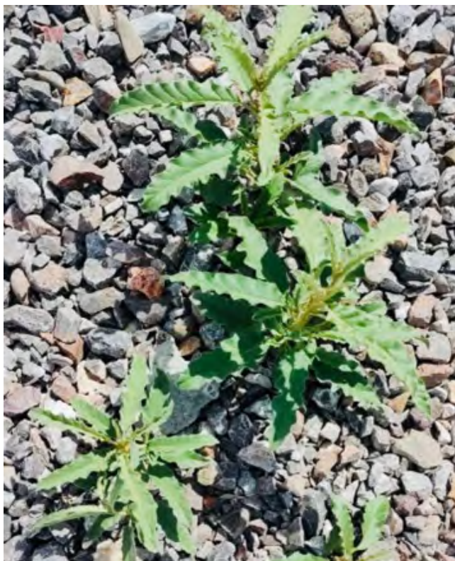
Figura 6. Solanum obtusifolium