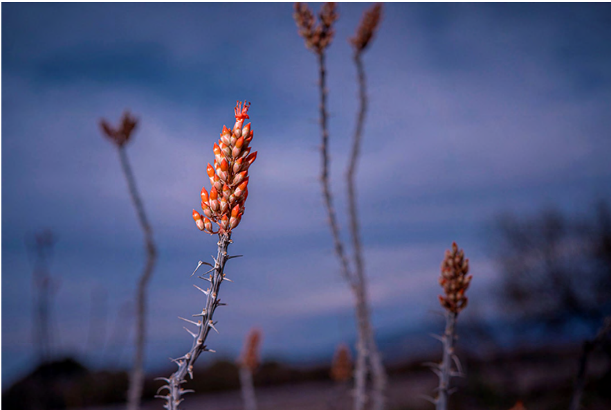
Figura 2. Fouquieria splendens