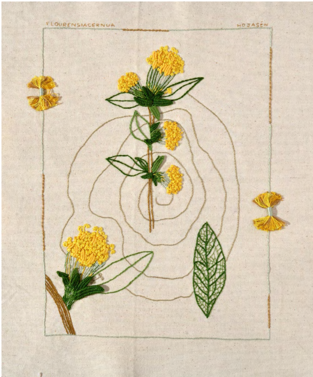
Figura 8. La voluntad, el fuego interior, 2023 (Hojasén [Flourensia cernua])

de relieve como el rococó, 2 el nudo francés 3 y el paso atrás/punto tallo. 4 Aunque estas puntadas no componen su uso medicinal, ya que son las hojas de las que se extrae la sustancia activa, consideré fundamental darle protagonismo a la flor para mostrar una faceta distinta de la planta.