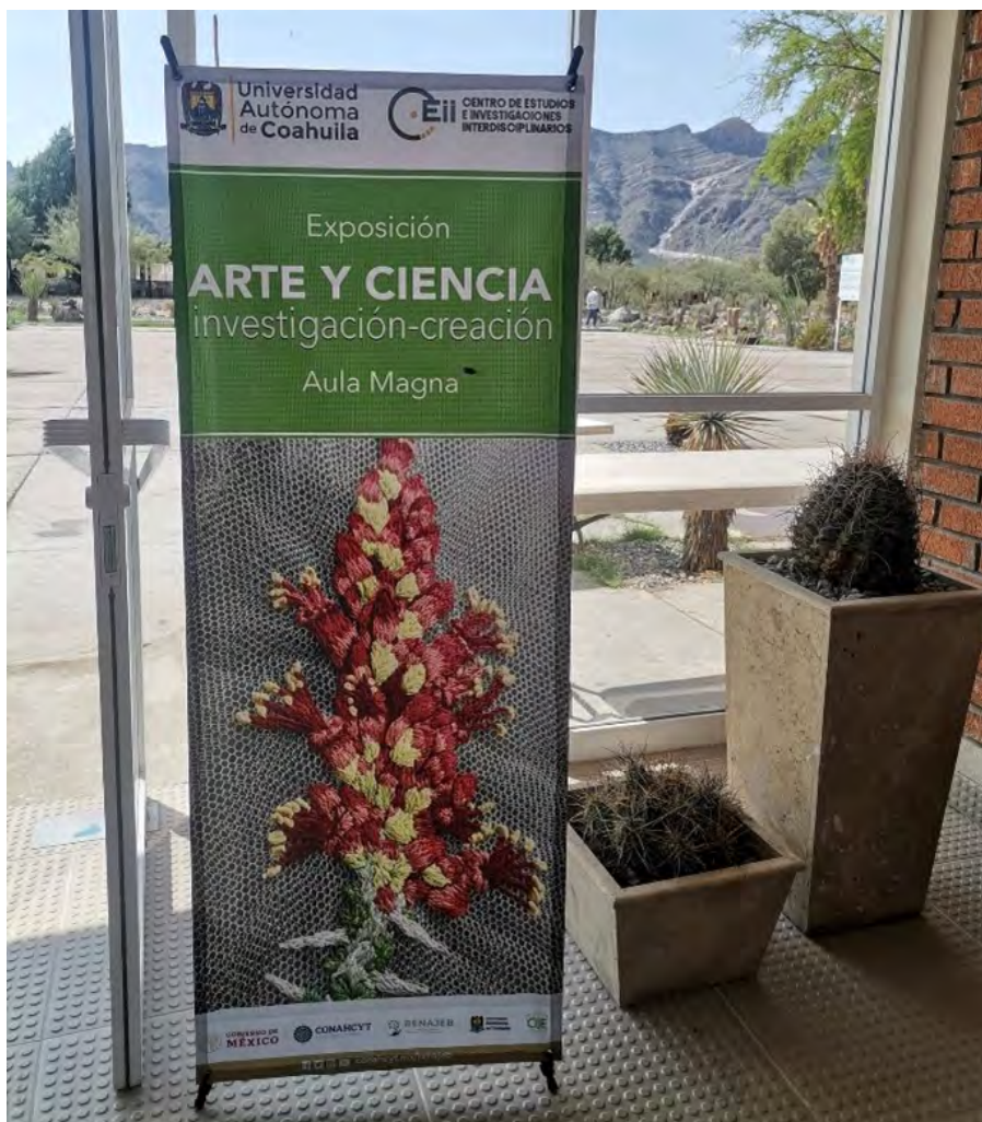
Fotografía: Alberto Daniel Ortiz Salas (2023).