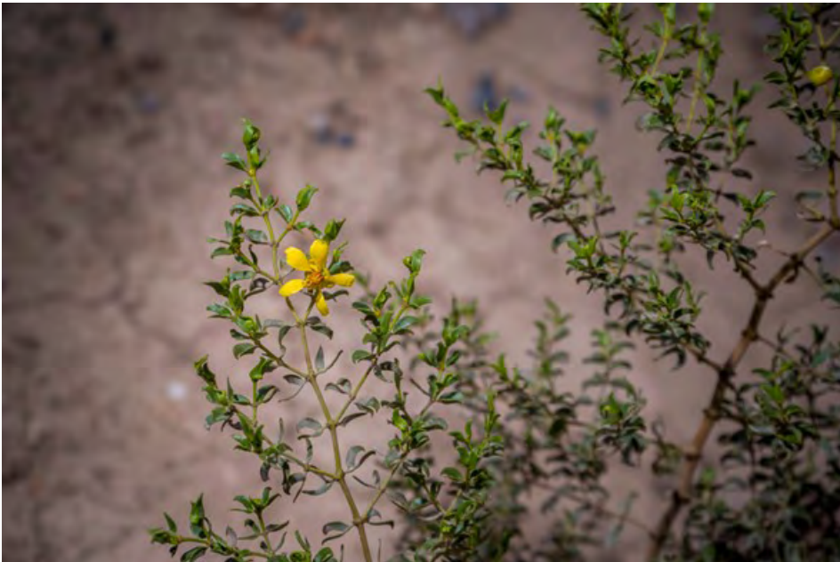
Figura 4. Larrea tridentata