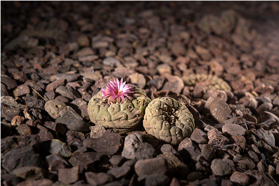
Figura 9. Lophophora diffusa