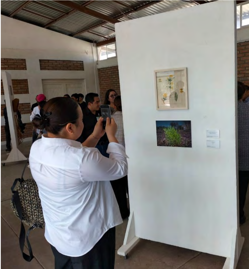
Fotografía: Alberto Daniel Ortiz Salas (2023).