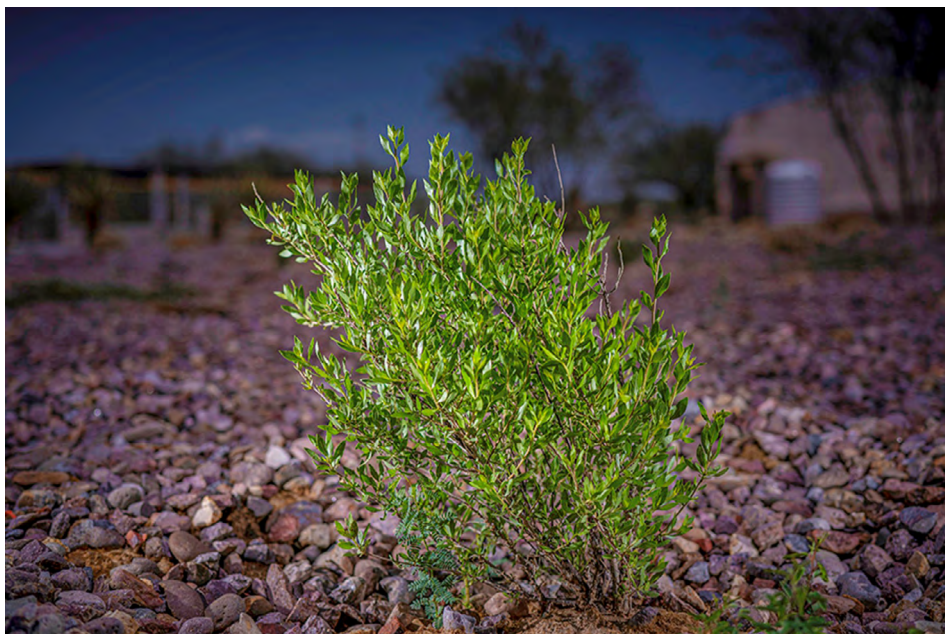
Figura 8. Flourensia cernua