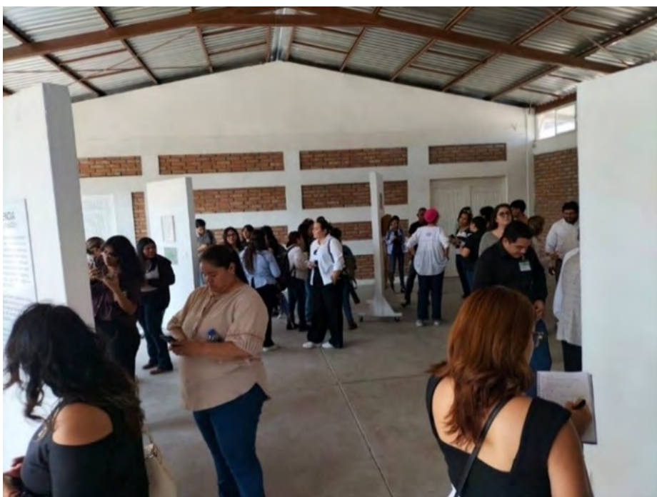
Fotografía: Alberto Daniel Ortiz Salas (2023).