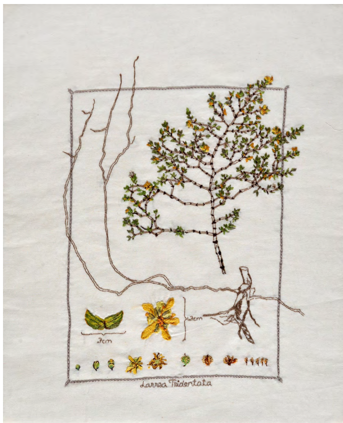
Figura 4. Contemplación , 2023 (Gobernadora [Larrea tridentata])