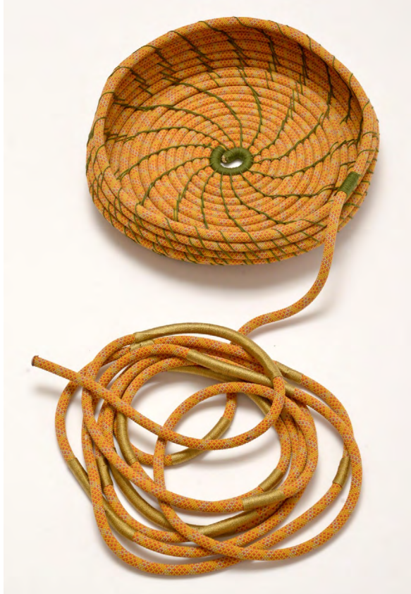
Figura 5. Flor de piedra , 2023 ( Siempreviva [Selaginella lepidophylla])