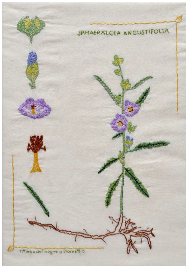
Figura 6. La búsqueda , 2023 ( Trompillo [ Sphaeralcea angustifolia ])