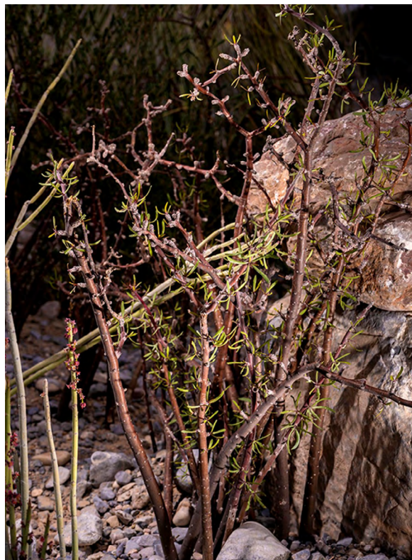
Figura 3. Jatropha dioica