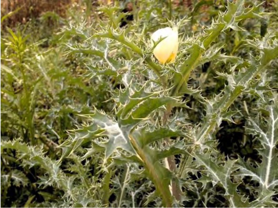
Figura 7. Argemone mexicana