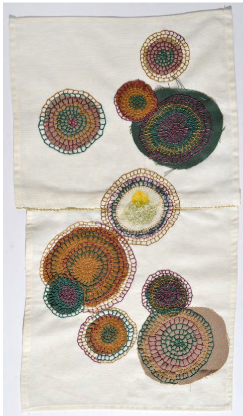
Figura 9. Hacia el centro: puntadas camino a la tranquilidad, 2023 (Peyote [Lophophora williamsii])