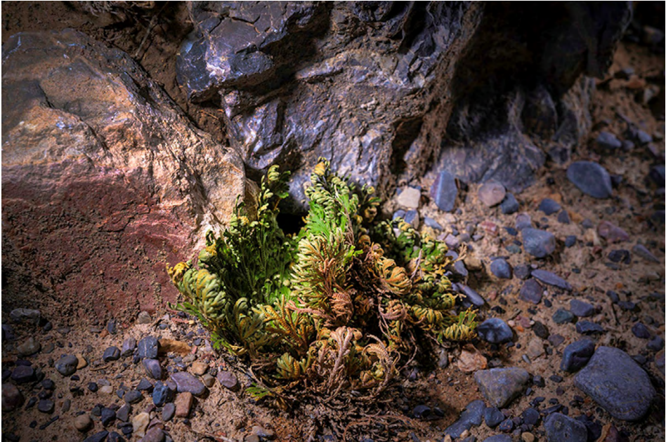
Figura 5. Selaginella lepidophylla