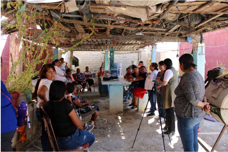
Fotografía: Cristian Torres León (2023).