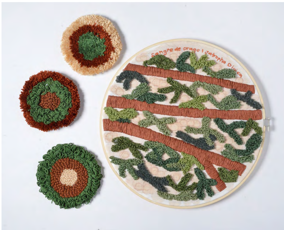
Figura 3. Bondad y milagro , 2023 ( Sangre de drago [ Jatropha dioica ])